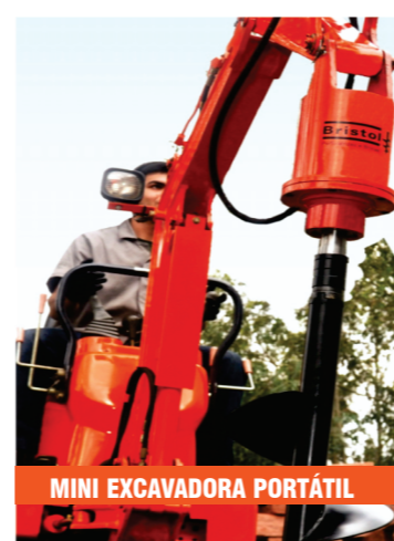
MINI EXCAVADORA PORTÁTIL

X - No aplicable. Las profundidades pueden variar según el tipo de suelo o las características del equipo en el que se acople la perforadora hidráulica Bristol. Atención: para alcanzar las profundidades deseadas deberá hacerse el uso de extensores. HB-16: por encima de 1m de profundidad es necesario el uso de extensores. HB-17, HB-19, HB-23 y HB-35: por encima de 2 m de profundidad es necesario el uso de extensores. Para perforaciones con profundidad por encima de la capacidad de levantamiento de la pluma de su equipo, es necesario desacoplar las extensores en el momento de retirar la broca del agujero.